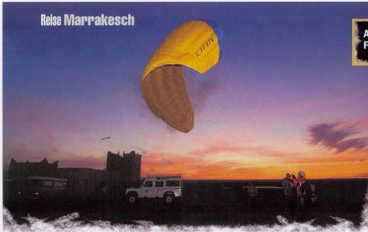
Abendliche Landung bei Ahmed's Guesthouse im Fluggebiet Aguer gour

Startüberhöhung! Die Gratrippe in sämtlichen Brauntönen von rötlich dunkel bis gelb durchmischt vor dem Hintergrund der gleißenden Schneegipfel und dem Vordergrund der grün bewachsenen Ebene ist eine prächtige Farbenschau. Genau das, wofür Marokkos Landschaft so weltberühmt ist.